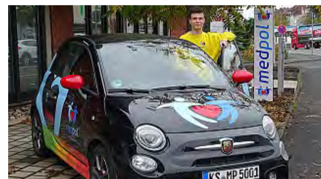
Blickfang: Die markanten Autos der medpol-Flotte sieht man auf Kassels Straßen regelmäßig, wenn das Pflegeteam im Einsatz ist.